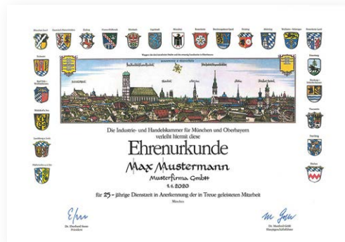
Urkunde klassisch Format: 49,5 x 34,4 cm/quer mit handkalligrafiertem Namen

Bitte 6 Wochen vor dem benötigten Termin beantragen!