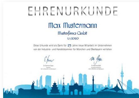
Urkunde modern Format: DIN A3/quer mit handkalligrafiertem Namen

Angaben für die Beschriftung der Urkunde: (Bitte am PC ausfüllen oder deutlich in Druckbuchstaben schreiben)