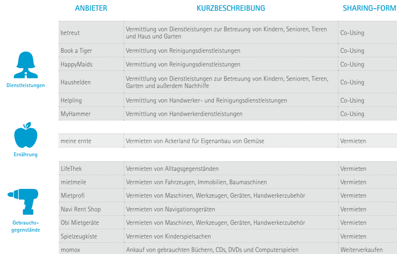
Tabelle 3: Abgrenzung von deutschen Shareconomy-Angeboten im B2C-Bereich [eigene Recherche]