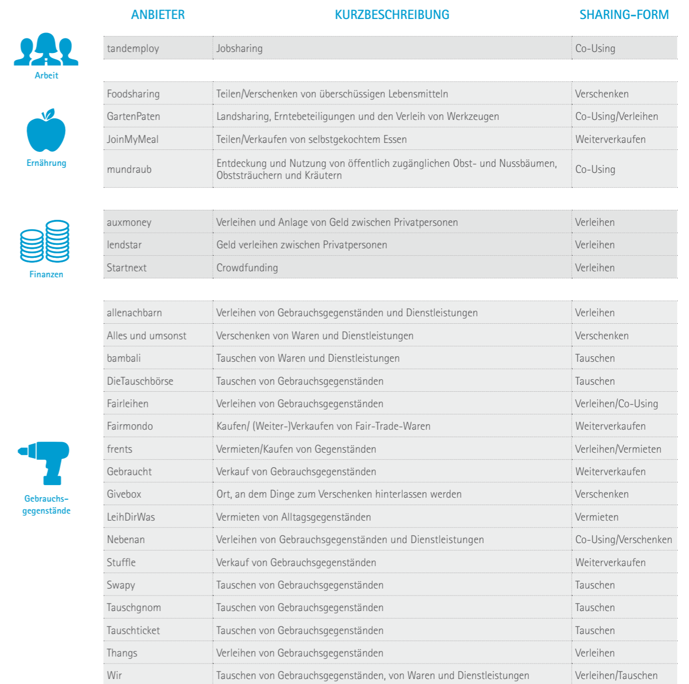
Tabelle 2: Abgrenzung von deutschen Shareconomy-Angeboten im C2C-Bereich [eigene Recherche]

Shareconomy-Aktivitäten im C2C-Segment haben sich in den letzten Jahren schwerpunktmäßig in den Bereichen Übernachtung, Bekleidung sowie Mobilität etabliert. Ebenso großen Anklang finden Angebote zahlreicher Online-Plattformen im Bereich Verleih und Tausch von Gebrauchsgegenständen. Aus der Fortführung der Idee bekannter Tauschplattformen entwickeln sich zudem Initiativen gegen Lebensmittelverschwendung. Auf Plattformen wie foodsharing.de sollen Lebensmittel „gerettet“ werden, indem sie mit anderen Nutzern geteilt werden, anstatt sie einfach wegzuerwerfen. Nach Angaben der Online-Plattform konnten so gegenwärtig knapp 7,8 Millionen Kilogramm Lebensmittel in Deutschland, Österreich und der Schweiz vor der Verschwendung bewahrt werden. Einen Ansatz aus der Finanzwirtschaft verfolgten verschiedene Plattformen, bei denen Nutzer Geld von anderen Nutzern leihen bzw. als Anbieter Geld an andere Nutzer verleihen können. Hierbei wird versucht, durch eine entsprechende bedarfsgerechte Risikobetrachtung Kapital für beide Seiten optimal einzusetzen. Einen nicht abschließenden Überblick aktueller Shareconomy-Angebote im C2C-Bereich zeigt Tabelle 2.