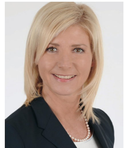
StMin Ulrike Scharf MdL, Bayerisches Staatsministerium für Umwelt und Verbraucherschutz