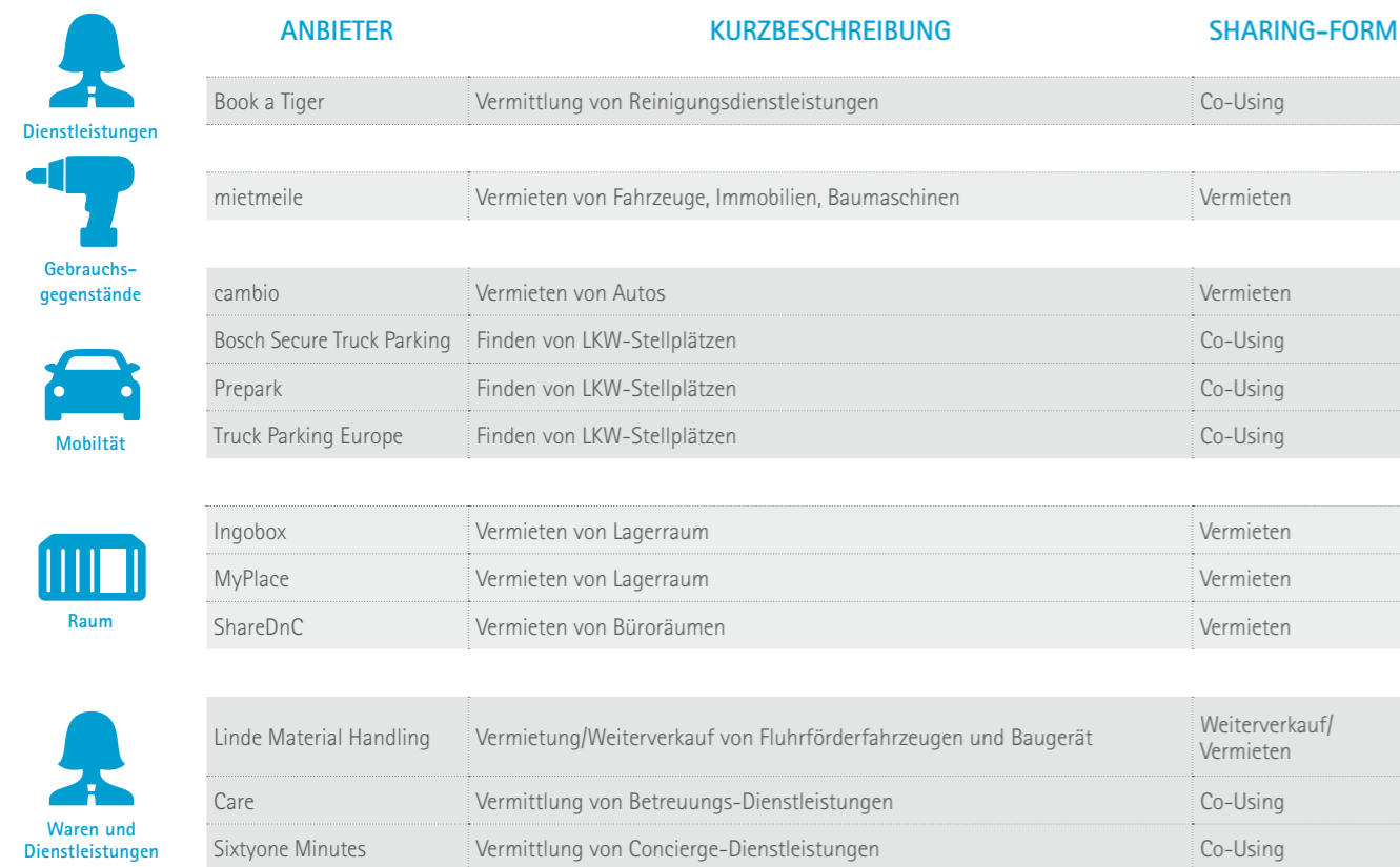
Tabelle 4: Abgrenzung von deutschen Shareconomy-Angeboten im B2B-Bereich [eigene Recherche]

B2B-Shareconomy unterscheidet sich vom C2C- und B2C-Bereich durch zwei wesentliche Merkmale. Einerseits werden im B2B-Bereich neben klassischen Gebrauchsgütern auch Austauschbeziehungen von Verbrauchsgütern betrachtet [20]. Somit zielen Shareconomy-Aktivitäten nicht ausschließlich auf eine verlängerte oder intensivere Nutzung von Gütern ab. Andererseits agieren Unternehmen mit ihren Wirtschaftsaktivitäten stets gewinnorientiert. Damit unterscheidet sich der B2B-Ansatz wesentlich vom „Tauschgedanken“ der C2C-Aktivitäten. Während die Gewinnorientierung bereits im B2C-Bereich auf Seiten der als Anbieter auftretenden Unternehmen inhärent zu betrachten ist, kann diese im B2B-Bereich auch als Möglichkeit der Kostenreduktion, beispielsweise durch die Einsparung von Energie- oder Entsorgungskosten u. ä., definiert werden. Folgt man dieser Definition, ergeben sich weitere Formen der Austauschbeziehung, die in Tabelle 5 aufgeführt werden.