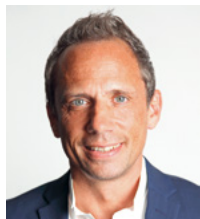
Thorsten Glauber, MdB Bayerischer Staatsminister für Umwelt und Verbraucherschutz