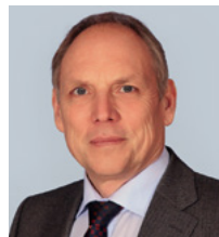
Claus Kumutat Präsident des Bayerischen Landesamts für Umwelt