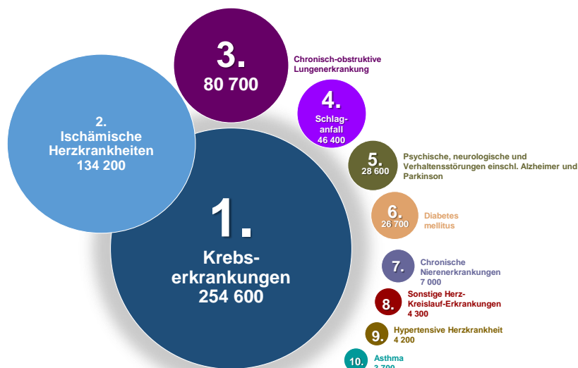
Abbildung 1: Die wichtigsten zehn nicht übertragbaren Krankheiten, die umweltbedingte Todesfälle verursachen

Ein Tätigwerden ist dringend geboten: Umweltverschmutzung kann Krebs, ischämische Herzkrankheiten, obstruktive Lungenerkrankungen, Schlaganfälle, psychische und neurologische Störungen, Diabetes und andere gesundheitliche Beeinträchtigungen verursachen 4 (siehe Abbildung 1). Trotz greifbarer Fortschritte war die Umweltverschmutzung 2015 immer noch die Ursache von schätzungsweise neun Millionen vorzeitigen Todesfällen weltweit (16 % aller Todesfälle) – dies ist das Dreifache der Todesfälle aufgrund von AIDS, Tuberkulose und Malaria zusammen und das Fünfzehnfache der durch Kriege und andere Formen von Gewalt verursachten Todesfälle. 5 In der EU ist jedes Jahr einer von acht Todesfällen auf Umweltverschmutzung zurückzuführen. 6