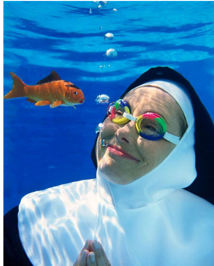
Die Unterwasserwelt erkunden