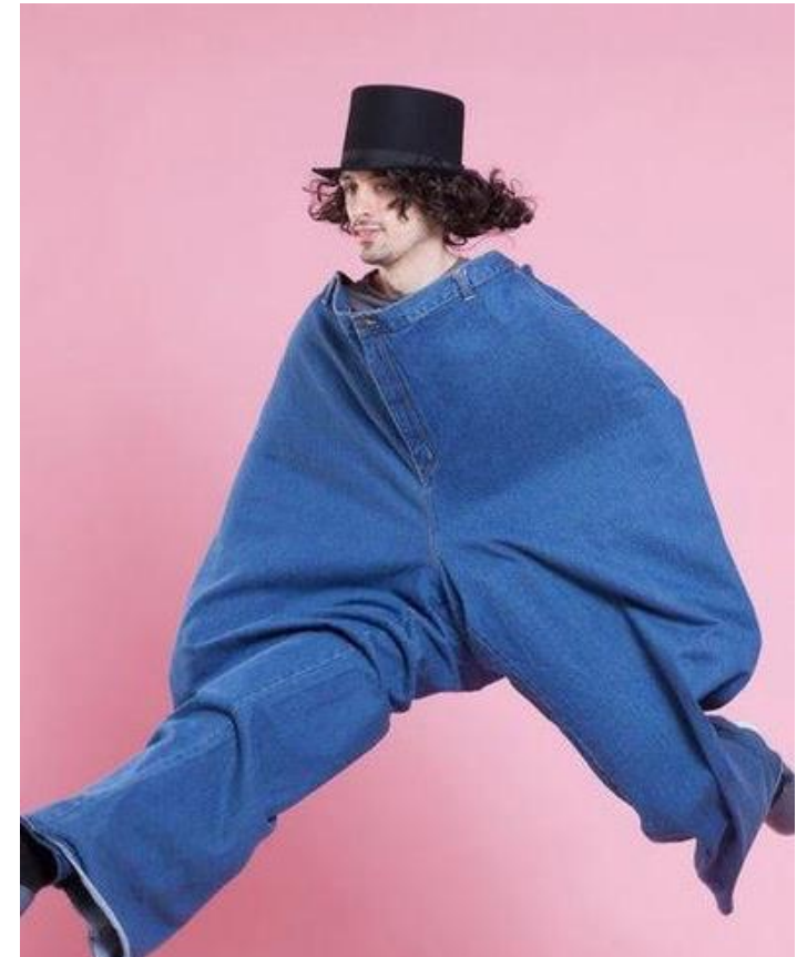
Neue Klamotten anprobieren