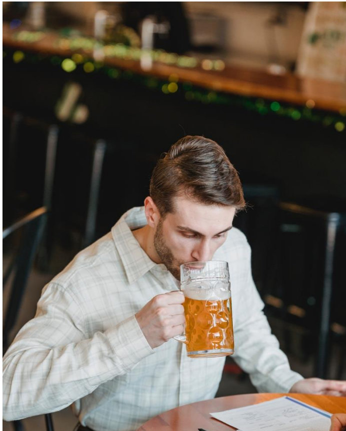
Dich während der Arbeit erfrischen