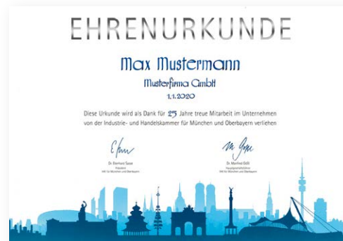
Urkunde modern Format: DIN A3/quer mit handkalligrafiertem Namen

Angaben für die Beschriftung der Urkunde: (Bitte am PC ausfüllen oder deutlich in Druckbuchstaben schreiben)