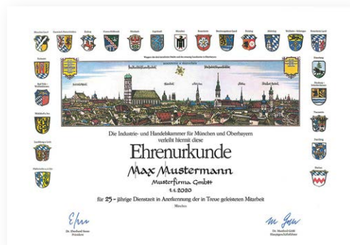
Urkunde klassisch Format: 49,5 x 34,4 cm/quer mit handkalligrafiertem Namen

Bitte 6 Wochen vor dem benötigten Termin beantragen!