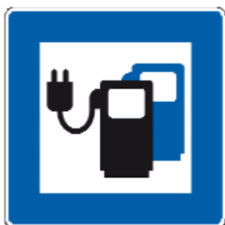
Verkehrszeichen 365-65 „Ladestation für Elektrofahrzeuge“

Auf diesen Parkflächen gilt für sogenannte Verbrennerfahrzeuge ein Parkverbot.