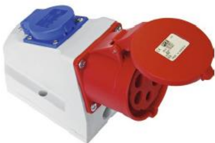
CEE-Wandsteckdose Combo mit Schutzkontaktsteckdose (IP44/54)