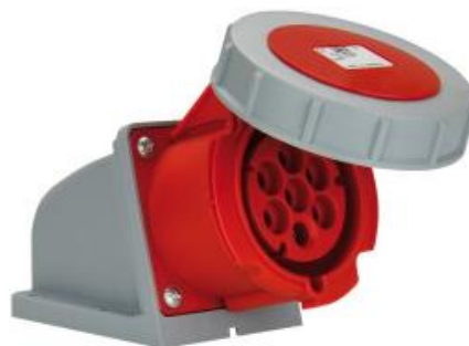
CEE-Industriesteckdose mit Schraubdeckel (IP66/67)