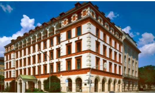
IHK für München und Oberbayern, Max-Josef Straße