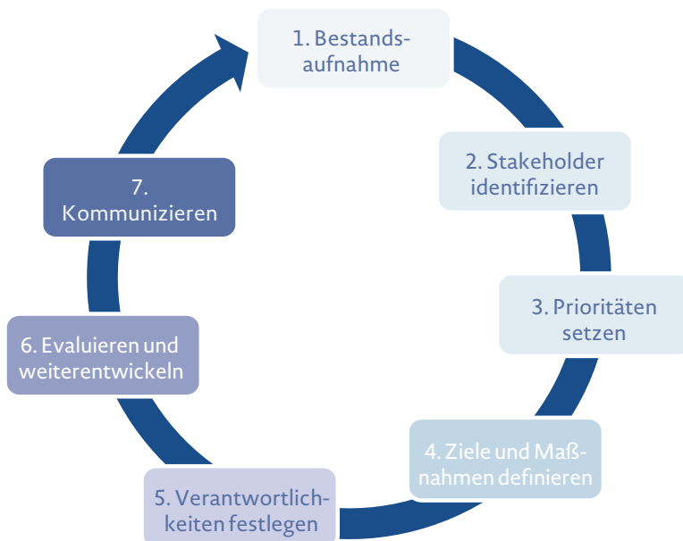
Abbildung 2: Sieben Schritte zu Ihrem CSR-Managementsystem

Die Etablierung eines CSR-Managements ist sicher mit einigen Veränderungen in Ihrem Unternehmen verbunden. Eine Orientierung bieten dabei die sieben Umsetzungsschritte, die im Folgenden skizziert werden. Die sieben Schritte ermöglichen es, systematisch und schrittweise vorzugehen. Sie machen somit das Thema CSR für Ihr Unternehmen operationalisierbar. Um Sie beim Aufbau eines CSR-Managementsystems zu unterstützen, finden Sie auf www.csr.bayern.de Managementblätter, die die Umsetzung jeden Schrittes erleichtern.