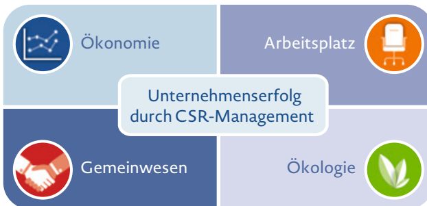
Abbildung 1: CSR-Handlungsfelder